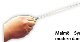
Malmö Symfoniorkester tolkar modern dansmusik på Stortorget.

5 Malmö Symfoniorkester spelar dansmusik av artister som Avicii och Swedish House Mafia mfl. Kl 21.15 på Stortorget.