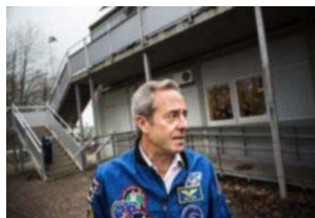
Jean-François Clervoy har varit i rymden tre gånger.