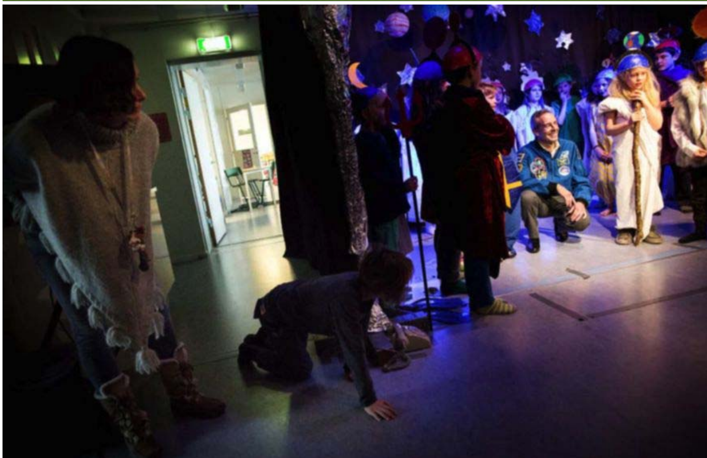
"Hälsa på vår franske gäst. Han i rymden varit mest", sjöng barnen på Vegaskolan för den franske astronauten.