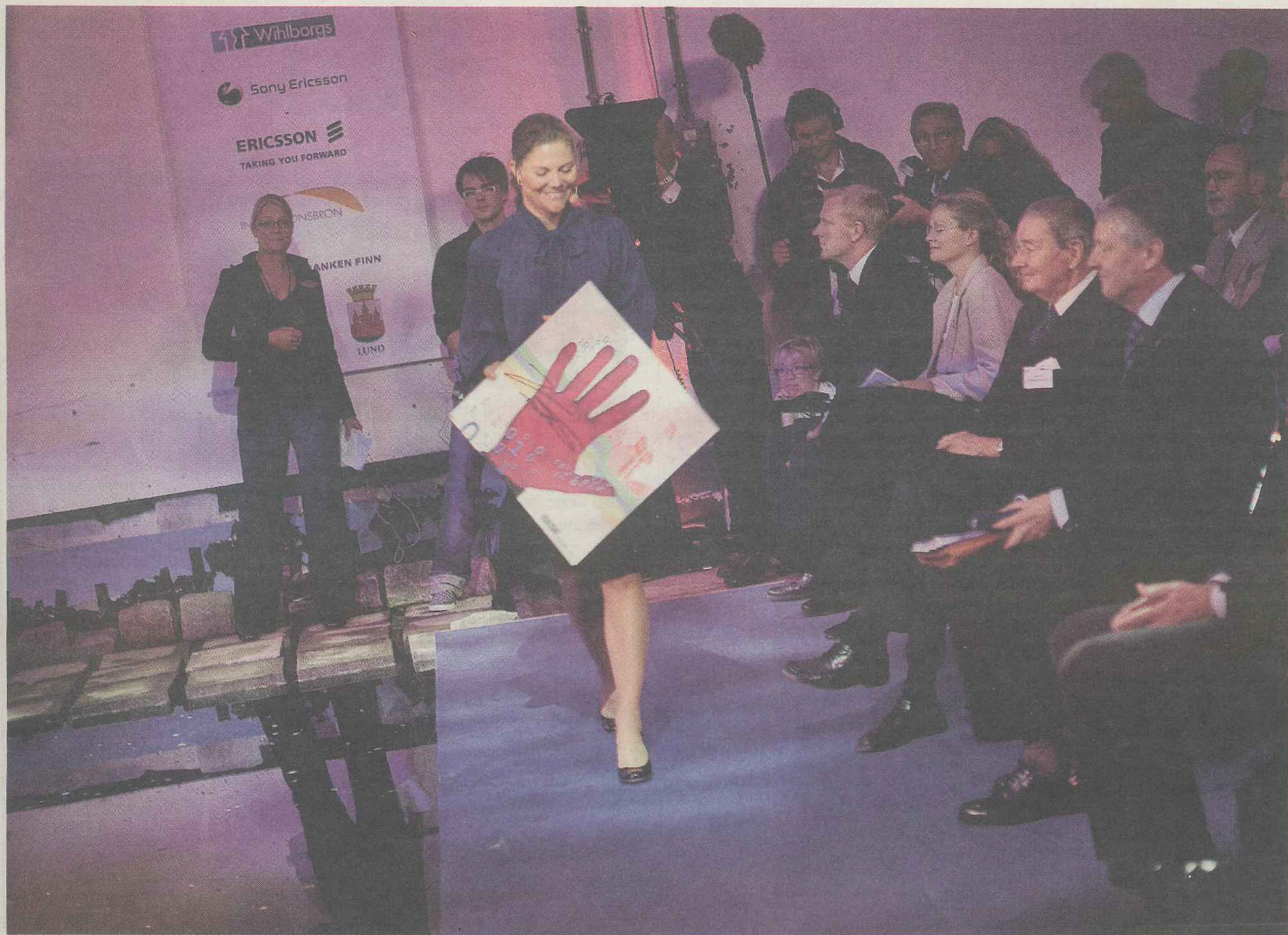
Hon gjorde en tavla - av sin egen hand. Kronprinsessan Victoria fick handen inskannad och sin egen tavla med sig som present.